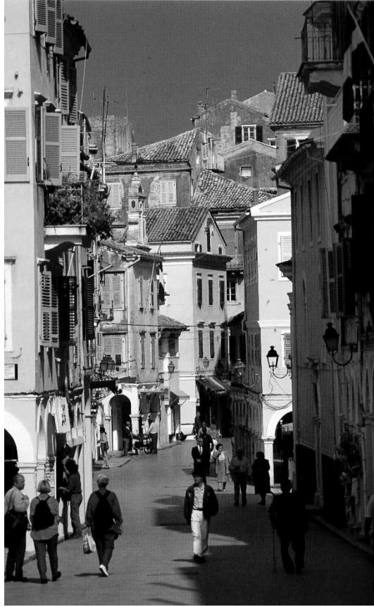
Rue de Corfou