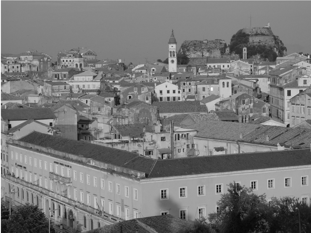
General view of the town