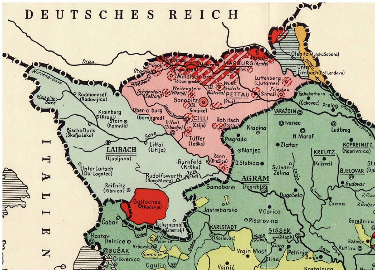
Abb. 1: Ausschnitt aus der Karte „Jugoslawien: Volkliche Gliederung Mehrheitsgebiet unter besonderer Berücksichtigung des Deutschtums“ (Straka 1941). Deutlich werden „Windische“ (rosa) von „Slowenen“ (hellgrün) unterschieden und somit eine Nähe zu „Deutsche“ (rot) suggeriert. Die Bedeutung der anderen Farben: hellgrün mit waagrechter Schraffierung: „Prekmurzen“; dunkelgelb: Ungarn; grün: Kroaten; gelbgrün: Serben.

terstellt (Promitzer 2004, 93). Die Aufgaben des „Südostdeutschen Instituts“ lassen sich in folgende Schwerpunkte gliedern (a.a.O., 100):