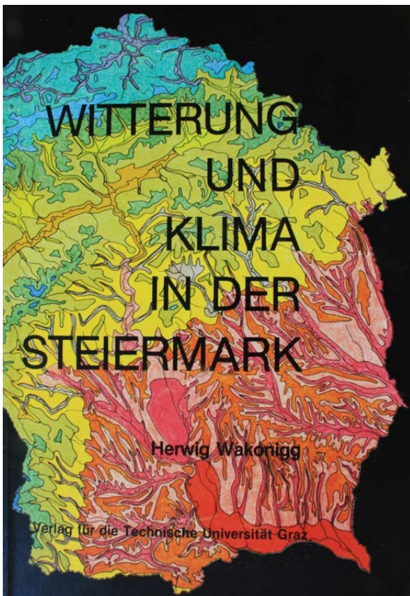
Abb. 1: Titelseite des Buches „Witterung und Klima in der Steiermark“ (Wakonigg 1978)