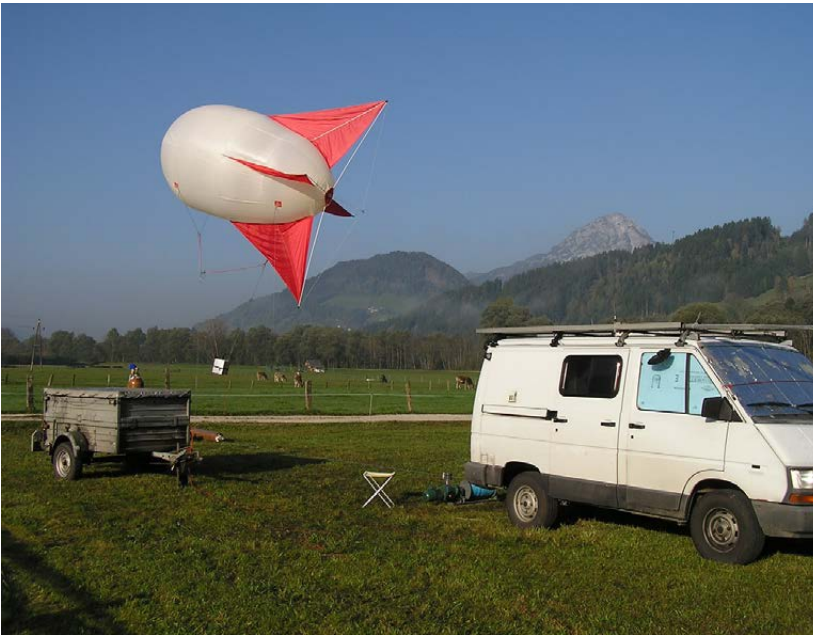
Abb. 6: Fesselballonsondierung am 13.10.2005 am Talboden des oberen Ennstales (Steiermark)

Studierende ihre Pflichtpraxis beim Wetterdienst, sondern es entstanden auch zahlreiche Diplom- und Masterarbeiten zu aktuellen klimatologischen Fragestellungen sowie zur Schnee- und Lawinenkunde, die in Kooperation mit der ZAMG von Lehrenden der Grazer Geographie betreut wurden. Beispielfähig seien hierzu einige der solcherart bearbeiteten Themenfelder genannt: Im Fachbereich Ausbreitungsklimatologie wurde die Entstehung des Flurwindes in Graz untersucht, worauf später ein numerischer Modellansatz aufbaute. Eine weitere Arbeit untersuchte die unterschiedlichen Stabilitätsindizes der ÖNORM-Ausbreitungsklassen aus einem langjährigen Datensatz am Sendermast Dobl. Weiters wurde in einer Masterarbeit ein Algorithmus definiert, welcher mit Hilfe von Radiosondendaten vom Grazer Flughafen Inversionshöhen- und -stärken für das Südöstliche Alpenvorland klassifizierte. Weitere Arbeiten befassten sich auch mit witterungsklimatologischen Fragestellungen, so etwa mit Zugbahnen von Gewittern in der Steiermark oder der Kulissenwirkung steirischer Gebirgszüge für die Schnee- und -verteilung, um nur einige zu nennen.