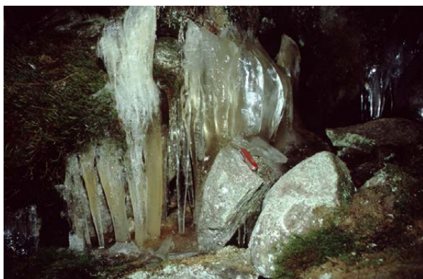
Abb. 5: Eisbildungen im unteren Teil der kalten Schutthalde am Pflüghof (Maltatal, Kärnten) in 890 m Höhe.

müssen und die Abkühlung unten nicht ohne Zusammenhang mit der Erwärmung oben funktionieren kann.