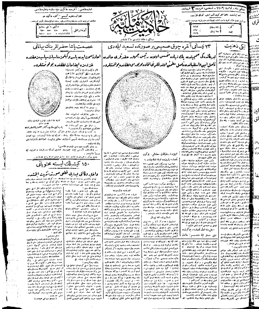
Hakimiyet-i Milliye- 25 Haziran 1924, sayfa: 1

150 Kişilik Liste Muhteviyâtı Dâhiliye Vekâleti Listeyi kat'î sûrette tespit etmiştir.