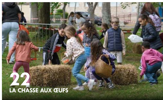
22 LA CHASSE AUX ŒUFS