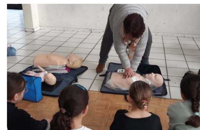
Prévention à l'école Georges Leplatre

15 SAMU, 18 pompiers, 112 Urgences Europe.