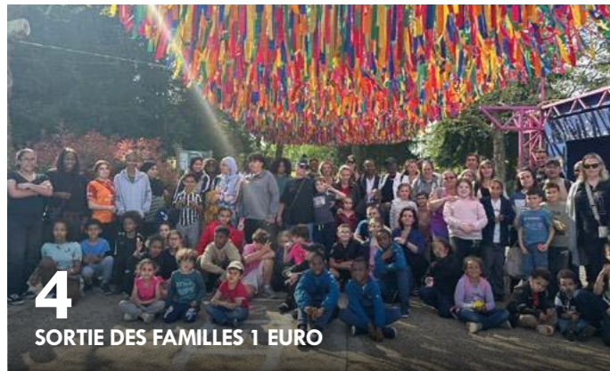
4 SORTIE DES FAMILLES 1 EURO