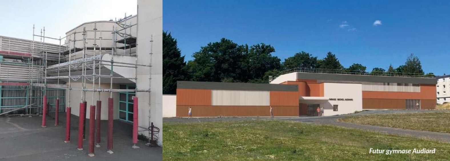
Futur gymnase Audiard