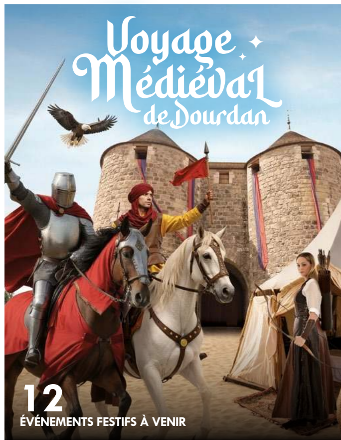
12 ÉVÉNEMENTS FESTIFS À VENIR