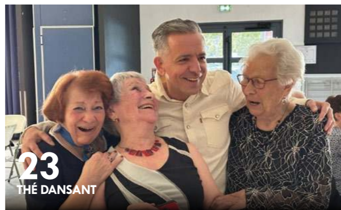
23 THÉ DANSANT