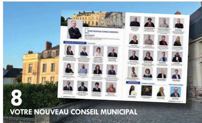
8 VOTRE NOUVEAU CONSEIL MUNICIPAL