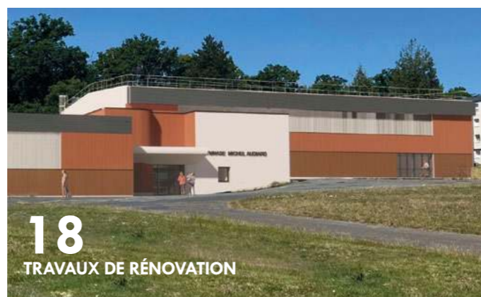
18 TRAVAUX DE RÉNOVATION