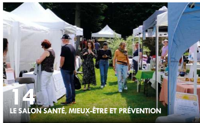
14 LE SALON SANTÉ, MIEUX-ÊTRE ET PRÉVENTION